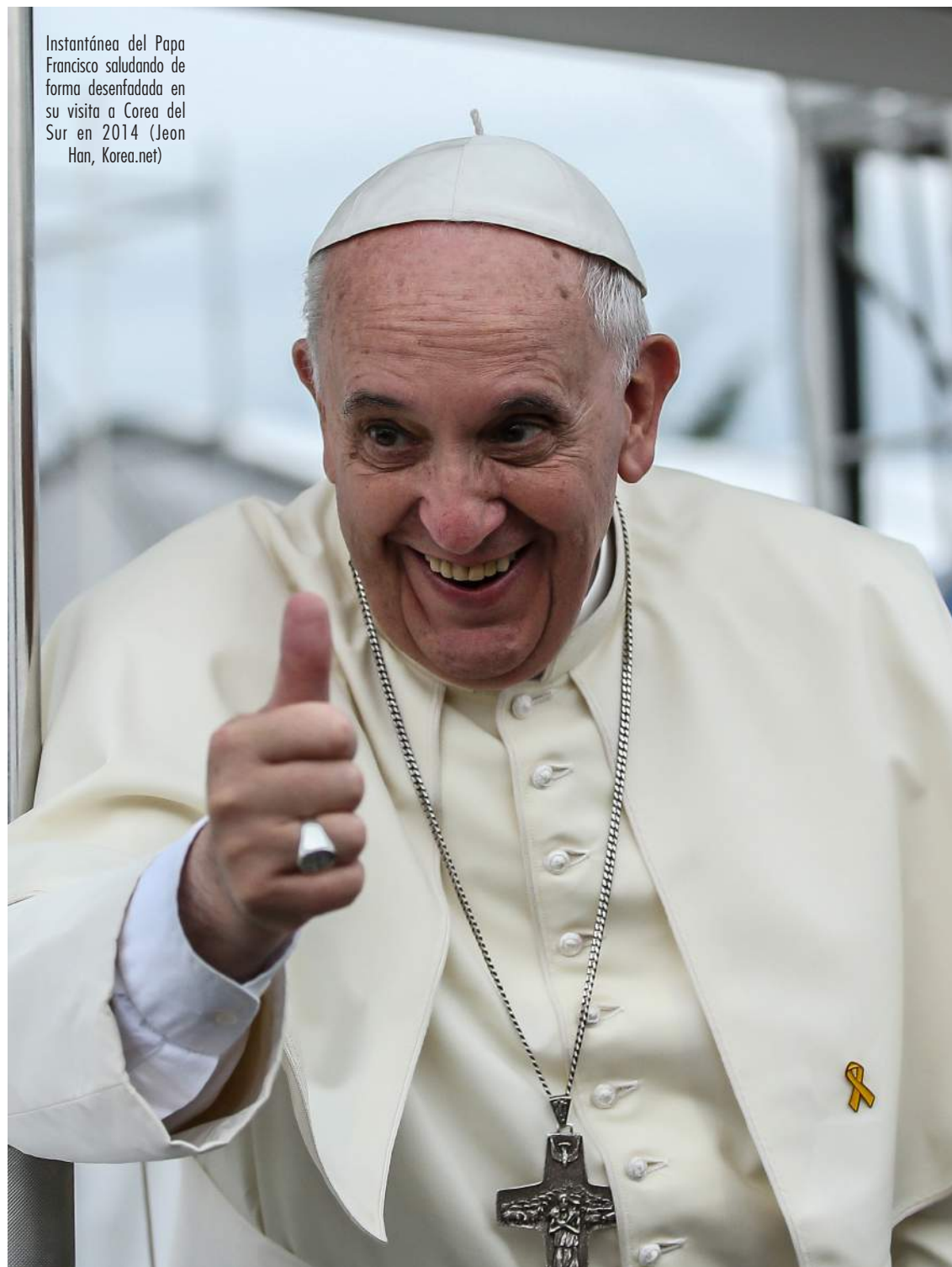
Instantánea del Papa Francisco saludando de forma desenfadada en su visita a Corea del Sur en 2014

por cuatro apartados: un total de 50 páginas de las 200 de nuestra edición de este documento. Y el Papa es muy claro en sus planteamientos: «Por consiguiente, nadie puede exigirnos que releguemos la religión a la intimidad secreta de las personas, sin influencia alguna en la vida social y nacional, sin preocuparnos por la salud de las instituciones de la sociedad civil, sin opinar sobre los acontecimientos que afectan a los ciudadanos» 15 . Y el Santo Padre argentino va aún más lejos: «Por eso quiero una Iglesia pobre para los pobres» 16 .