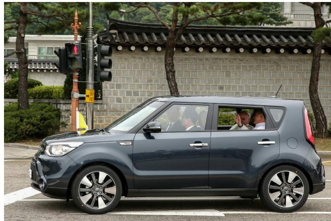
Francisco, un Papa poco dado al protocolo, aparece montado en un sencillo utilitario KIA en su visita a Corea del Sur en 2014

Cuando le comunicaron su elección, Bergoglio dijo que los señores cardenales habían elegido a un gran pecador 32 . Después,