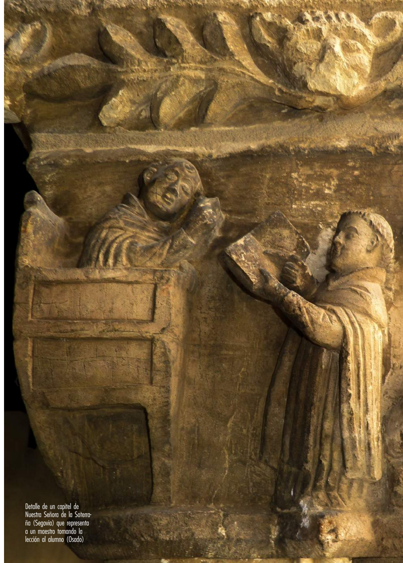
Detalle de un capitel de Nuestra Señora de la Soterraña (Segovia) que representa a un maestro tomando la lección al alumno (Osado)