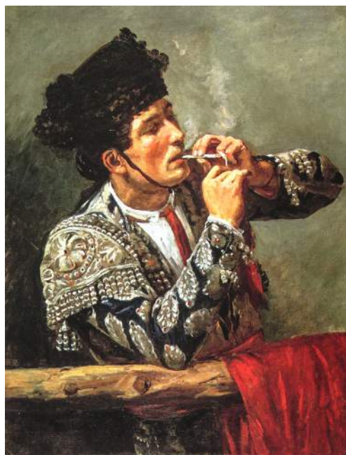
Toreador (1873), óleo de Mary Cassatt (1844-1926)

Los impuestos sobre las labores del tabaco pertenecen a los llamados «impuestos especiales» sobre «consumos específicos». Habitualmente, entran también en este