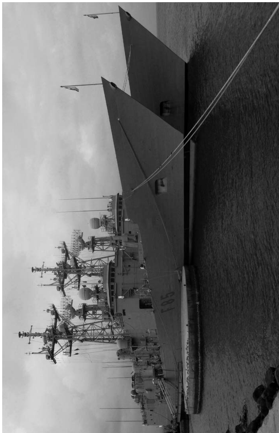
Figura 2. Las fragatas de la Armada española. "Navarra" (F-85) y "Canarias".