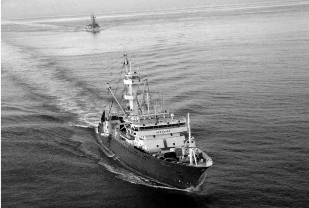
Figura 1. El pesquero “Alakrana” seguido de la Fragata “Canarias” rumbo a las Seychelles en noviembre de 2009.

Eyl para cargar víveres y volvieron a zarpar para evitar su localización. El Ejecutivo reaccionó como si hubiera sido sorprendido, y particularmente incómodo, dando la impresión de que deseaba deshacerse por la vía rápida de este remoto problema con un mundo subdesarrollado con el que presumía de gran sensibilización, solidaridad y humanitarismo. De ninguna manera iba a proceder como había hecho el francés con los yates Le Ponant y Tanit .