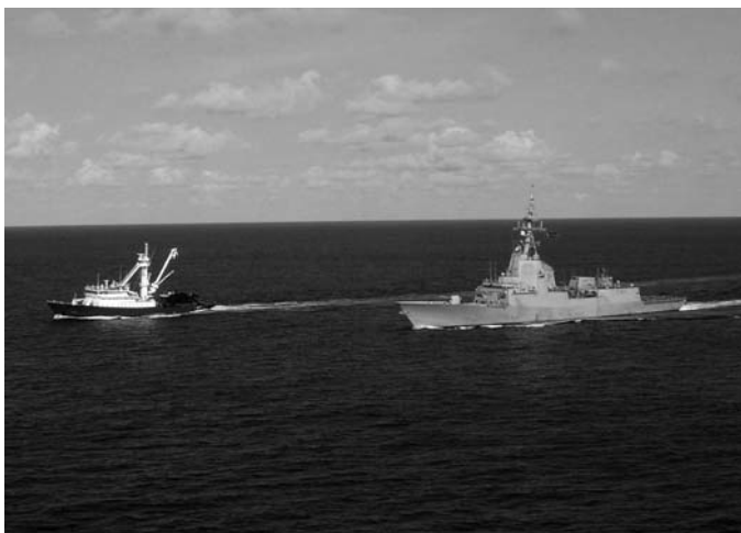
Figura 3. El pesquero español “Playa de Bakio” escoltado por la fragata “Méndez Núñez” en abril de 2008.

No obstante, la fragata, de la que parecía pretenderse el absurdo de que no cumpliera con su obligación, siguió en pos del Alakrana , mientras el Ministerio de Defensa se justificaba ante la opinión pública alegando que el pesquero estaba fuera de la Zona de Protección, provocando la ira de los armadores. Esta vez, en la persecución se traspasó el límite de las aguas jurisdiccionales para seguir al pesquero secuestrado hasta el nido de los secuestradores, la aldea de Haradhere, un villorrio a 20 km de la costa donde no hay puerto ni refugio alguno y donde permanecían fondeados otros cuatro barcos previamente asaltados. El Alakrana se unía a ellos. Cuando, en plena noche, dos de la docena de piratas que habían perpetrado el secuestro decidían ir a tierra, la Canarias , en una operación de comando, los detuvo. En España, una atribulada opinión pública se llevaba las manos a la cabeza: haber tomado dos “rehenes” sólo serviría para com-