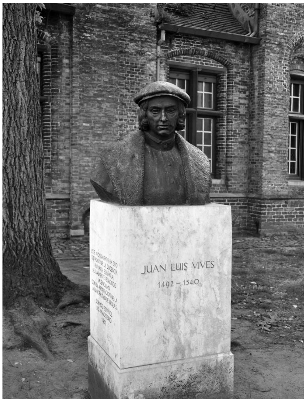
Figura 2. Busto de Juan Luis Vives (Valencia, 1492 - Brujas, 1542) en Brujas. Marañón escribió con admiración en varias ocasiones sobre el gran pensador y pedagogo.